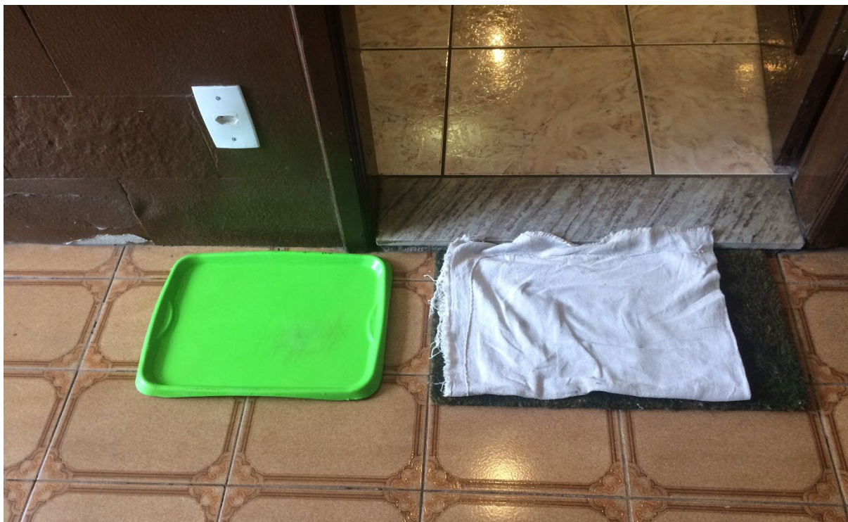
Figura 6- Recipiente para higienização dos calçados