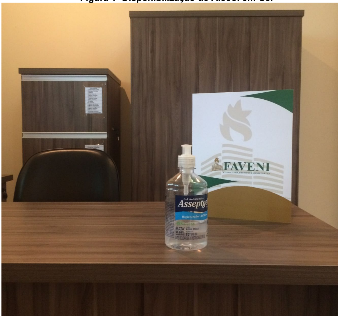
Figura 1- Disponibilização de Álcool em Gel

Já no início do mês de março de 2020 a empresa disponibilizou o álcool em Gel em todos as salas, além de reforçar os cuidados coma limpeza dos ambientes.