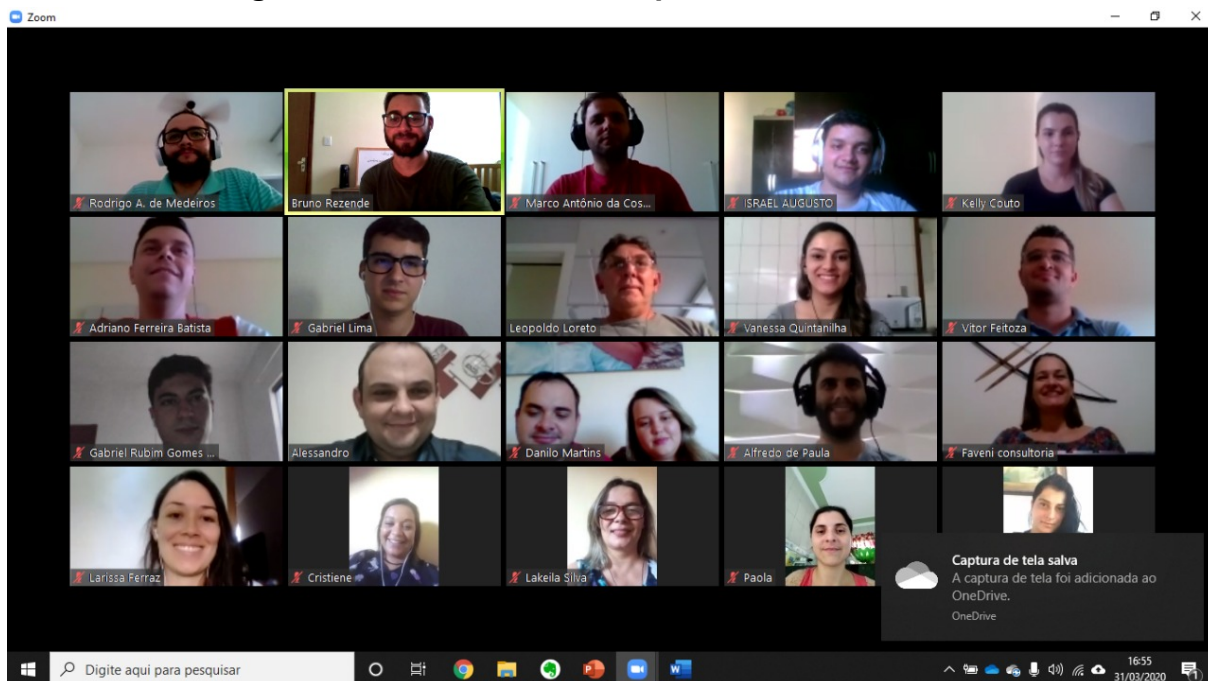
Figura 2- Reunião durante o período de home office